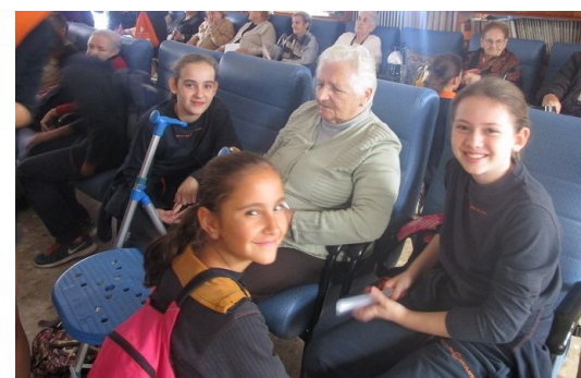
Voluntariado en Santa Mónica